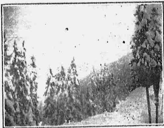
Χιονισμένο Ἑλβετικὸ δάσος

Ὅλες οἱ ἐπιφάνειες ποῦ βλέπουν στὸν οὐρανὸ δὲν ἔχουν ἄλλο ἀπὸ τὸ λευκὸ - τυφλωτικὸ χρῶμα τοῦ χιονιοῦ. Οἱ κῆποι σκεπάζονται, τὰ πεζοδρόμια