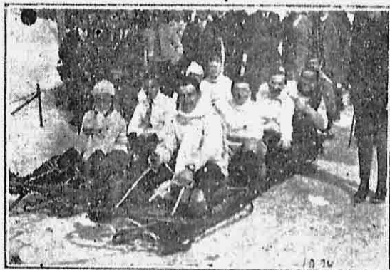
Τὰ μπόμπ που ἐνίκησαν

Τὸ πατινοῦρε εἶναι ἕνα τεράστιο σαλόνι μὲ χιόνινο παρκέτο που εἶναι ἀπηγορευμένη ἢ εἰσόδος στοὺς μὴ ἐξησκημένους ἐπὶ ποινῇ ἀτελευτήτων πτώσεων.