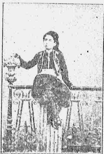
Είς ηλικίαν 8 ἐτῶν