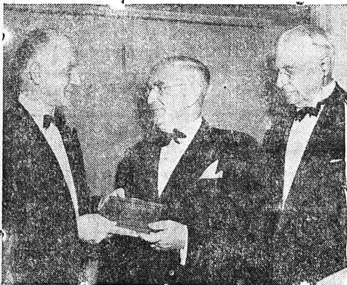
Ο Ρεπουμπλικάνος γεροισαΐτης Γ. Μ. Βάντεμπεργκ, 75 ετών, μέχρι πρότινος κατείχε την θέση του προέδρου της Γερουσίας, εξουλοδοξεί πάντοτε να αποτελεί μίαν από τις μεγαλύτερες φωνές του Εθνικού Κοινοβουλίου. Είς την εικόνα δεξιά, Βάντεμπεργκ παραλαμβάνει από τον Δόκτορα Μπαρούζ το Διερευνητικό σχέδιον δια την επίβλησιν διεθνούς έλλοχου επί της ατομικής ενεργείας.