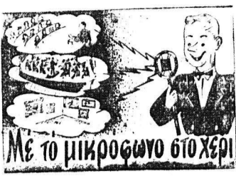
Με τὸ μικροφῶνον διὰ χερὶ