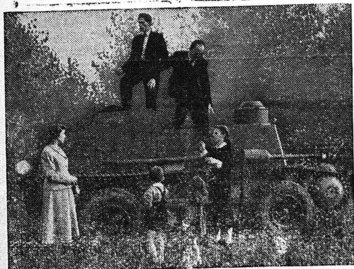
Έμπε γνωστόν εις όλον τον κόσμο το κτήσθημα του Τσεχοσλοβακίου Ούλιου. Μαζὺ μὲ τὴν οικογένειάν του καὶ φίλους του, κατόρθωσε νὰ διαφύγῃ ἐκ τῆς δουλοπλουτίας τῆς Ὀκ. Οὐλίου ἐξελισσόμενος εἰς τὴν εὐτυχίαν καὶ ἀνεξαρτησίαν τοῦ ἐλευθέρου λαοῦ τῆς Τσεχοσλοβακίας.