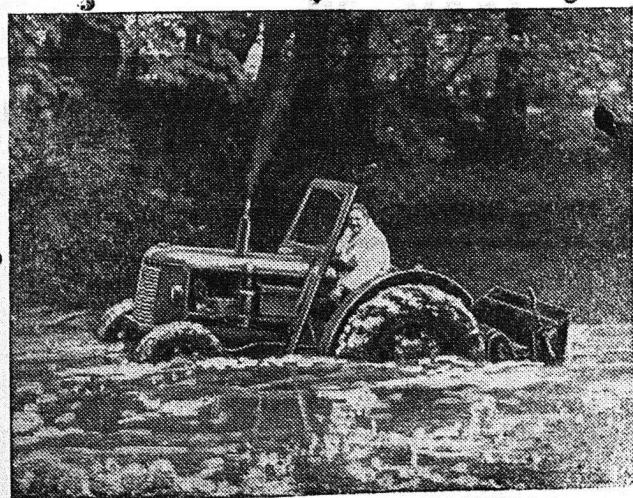
NEON ΓΕΩΡΓΙΚΟΝ ΜΗΧΑΝΗΜΑ