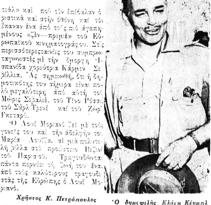
Ο δημοφιλής Κλέακ Κήμηλ