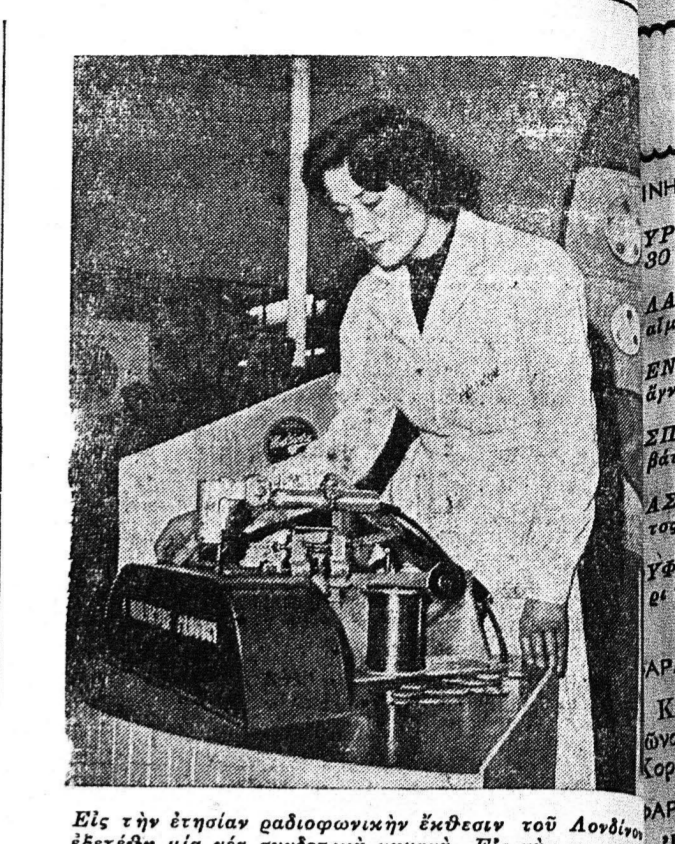
... Εις την ετησίαν ραδιοφωνικήν έκθεσιν...