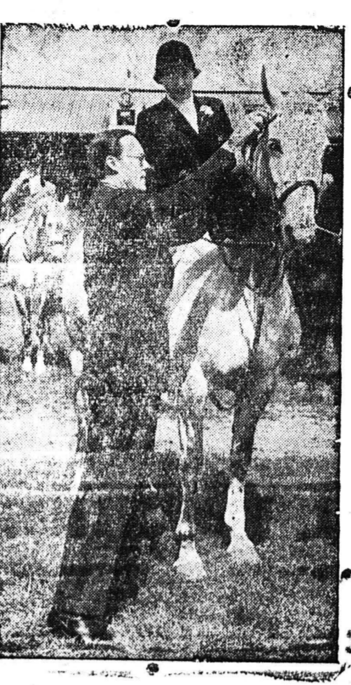
... Ο σύζυγος της βασιλίσσης της Ολάνδίας...