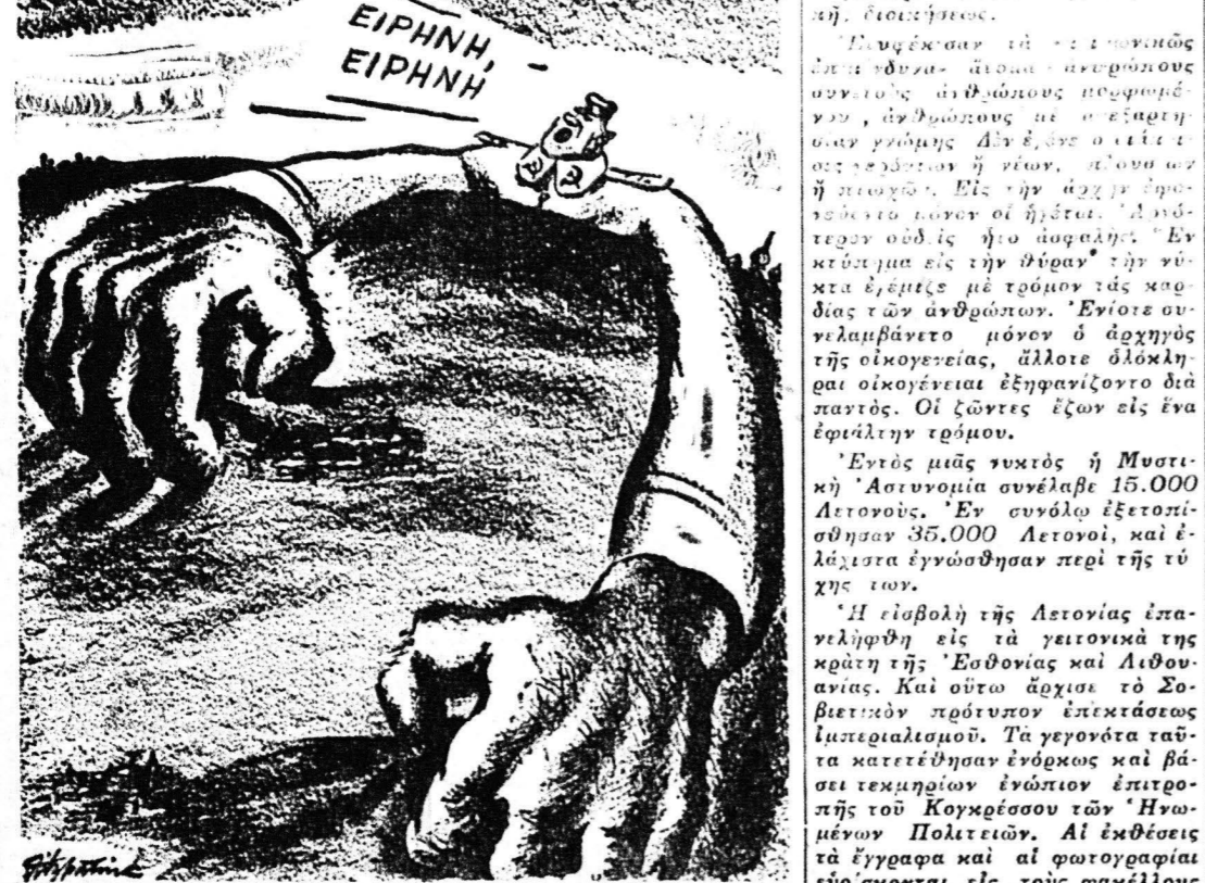
ΕΚ ΤΗΣ ΗΜΕΡΗΣΙΑΣ ΕΦΗΜΕΡΙΔΟΣ, "ΣΑΙΝΤ ΛΟΥΗΣ ΤΡΟΣΤ ΝΤΙΣΤΑΤΣ", ΣΑΙΝΤ ΛΟΥΗΣ, ΜΙΣΣΟΥΡΙ, ΗΝ. ΠΟΛ. ΑΜΕΡΙΚΗΣ

Η ΦΩΝΗ ΕΙΝΑΙ ΦΩΝΗ ΤΗΣ ΕΙΡΗΝΗΣ, ΑΛΛ' ΑΙ ΧΕΙΡΕΣ ΕΙΝΑΙ ΧΕΙΡΕΣ ΤΗΣ ΑΡΠΑΓΗΣ