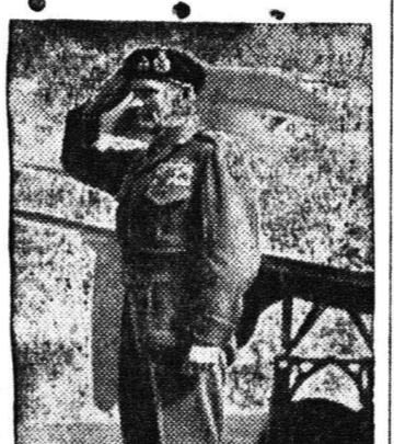
Ο στρατάρχης Μοντεντσί...

ΠΛΗΡΗΣ ΕΠΙΣΤΑΣΗ ΤΗΝ ΗΜΕΡΑΝ Οι κ. κ. Μοντεντσί και Κιχάνοβιτς, αρχισυντάκτες των δημοσίων συμβουλίων, εισηγήθησαν με την διακήρυξιν ότι η συμφωνία αυτή αποτελεί τον πιο σημαντικό σημείο της ιστορίας των διεθνών σχέσεων, ειδικά διότι η συμφωνία αυτή αποτελεί την πρώτη φορά που η Γερμανία καθιστάται κυρίαρχο κράτος. Η συμφωνία αυτή αποτελεί τον πιο σημαντικό σημείο της ιστορίας των διεθνών σχέσεων, ειδικά διότι η συμφωνία αυτή αποτελεί την πρώτη φορά που η Γερμανία καθιστάται κυρίαρχο κράτος.