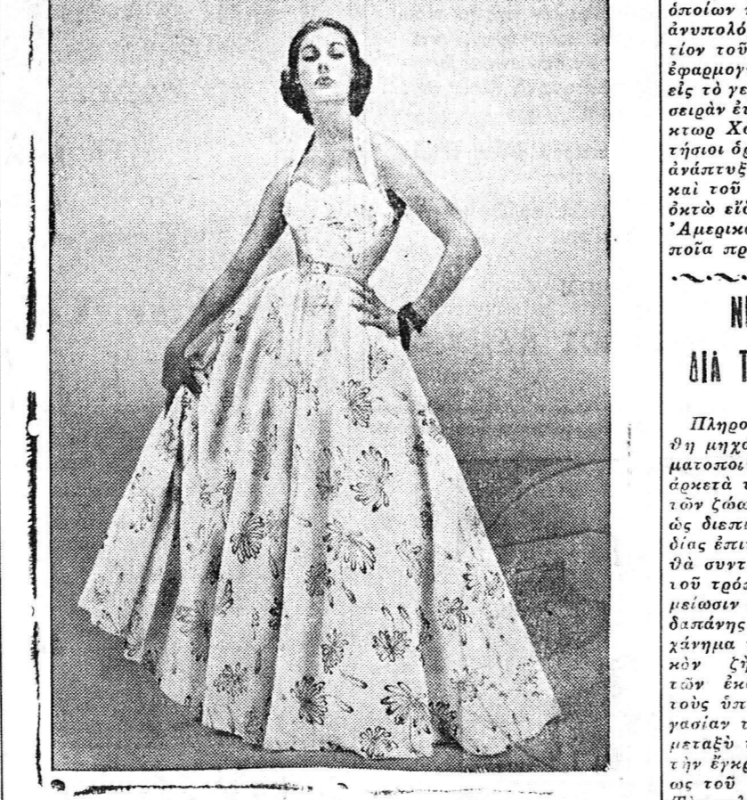
Τα φορέματα από βαμβάκερο ύφασμα είναι πολύ της μόδας. Είς την φωτογραφίαν μία βαμβάκερη βαδυνή έμπεριμ τοιαύτα