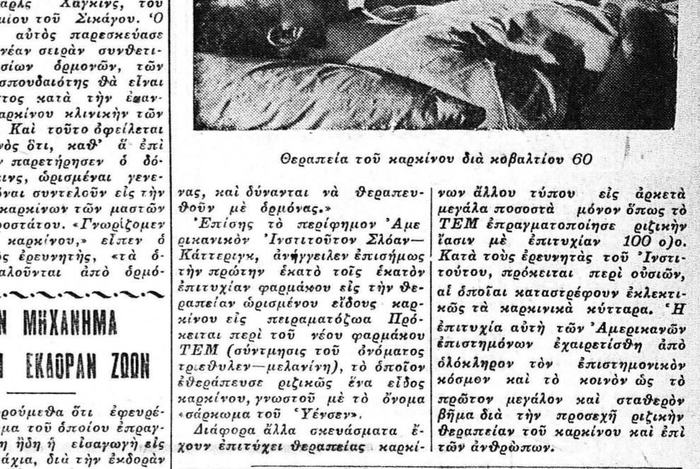
Θεραπεία του καρκίνου δια κοβαλτίου 60