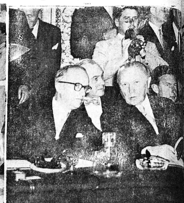
1) Αί συζητήσεις εις τόν ΟΗΕ συνεχίζονται. Εις τήν φωτογραφίαν εξ άριστερών ό Άμερικανός κ. Λότς, ό Άγγλος κ. Λούδ και ό Ρώσος κ. Βερίνσκυ, ενώ συνεζητείτο τό Κουρπελάκον 2) Εις τό Σαίν Έτιέν διεξήχθη πρό ήμερών διαγωνισμός ατομικών ελικοπτερίων. Τό εικονιζόμενον ελικοπτερον θύναται νά πετάξη επί 10 ώρας με ταχύτητα 350 χιλ. τήν ώραν εις ύψος 2.400 μ. 3) Η έξεπεθεώρησης του τιμητικού άποσπάματος υπό του στρατάρχου Μονγκόμερυ εις Άθήνας ύπέρξεν, ως συμβάνει σπανίως λεπτομερεστάτη. Εις τήν εικόνα ό θρυλικός Μόντυ εις τό Μνημειον του Άγνώστου Στρατώτου. 4) Τό μεγαλύτερον γεγονός του έτους και όλων των μεταπολεμικών έτων ύπέρξεν, ή ύπογραφή τής 5μεροδς συμφωνίας του Άουδίνου, διά τής οποίας ή Γερμανία, ως ανεξάρτητον κράτος, εισέρχεται πλέον εις τό Ευρωπαϊκόν σύστημα άμύνης.

ΕΛΛΙΟΔΙΑΧΩΡΙΣΤΗΡΕΣ «ΠΙΕΡΑΛΙΖΙ» ΙΤΑΛΙΑΣ ΠΕΤΡΕΛΑΙΟΜΗΧΑΝΑΙ ΑΓΓΛΙΑΣ — ΓΕΡΜΑΝΙΑΣ ΜΗΧΑΝΗΜΑΤΑ ΗΛΕΚΤΡΟΣΥΓΚΟΛΛΗΣΕΩΣ Περιστροφικά και Μετασχηματιστάι