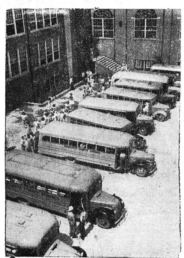
Εις την 'Αμερικην ύπάρχουν περισσότερα άπό 99.000 σχολικώσφορα τα όποια μεταφέρουν καθ' ήμέραν, δαπάναις του δημοσίου, τών μαθητάς των άγροτικων περιούων και τών σπουδαιών, άπό τό σπίτι εις τό σχολειον και τιάταλάιν.

ΑΙ ΕΚΔΟΣΕΙΣ 'ΜΠΕΡΚΑΗ, Σας προσφέρουν δια τας εορτάς τα καλύτερα λογοτεχνικά βιβλία. 1) Άνας—Μαρία Σελίνος: «ΝΤΕΖΙΡΕ» 2) Α. Α. Βασιλάς: «ΙΣΤΟΡΙΑ ΤΗΣ ΒΥΖΑΝΤΙΝΗΣ ΑΥΤΟΚΡΑΤΟΡΙΑΣ» 3) Μόργκαριε Μίσελ: «ΟΣΑ ΠΑΙΡΝΕΙ Ο ΑΝΕΜΟΣ» 4) Λέων Νεζχλάς: «Ο ΧΙΤΩΝ» 5) Ίρβινγκ Στέν: «ΒΑΝ ΓΚΟΓΚ» Με δεκαεπενθήμερες δόσεις των 15 δραχ. ή τοις μεσηροτόσι. Έπίσης πώλησις χορηγική με τιμής κώστων. Άποκλειστικώτερις δια τας Πάτρας ΓΡΑΦΕΙΟΝ ΑΝΤΙΠΟΡΟΣΠΟΝ Ε. Β. Η. Π. Γερεκιστοπούλου 48α ΠΑΤΡΑΙ