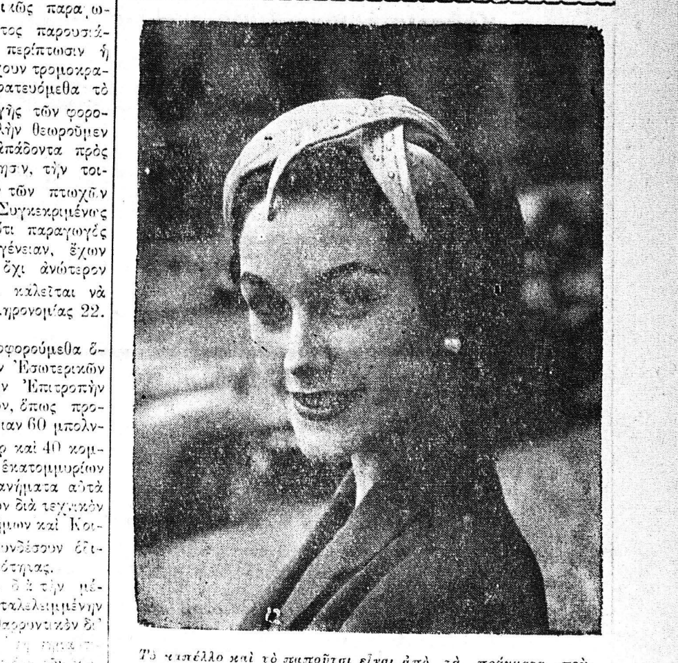
Το κεφάλο και το πιστόλι είναι άπό τα πρήγματα που...