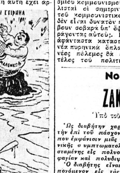
ΜΙΚΡΙΑ ΑΡΟΤΗ ΓΕΙΩΜΕΝΑ