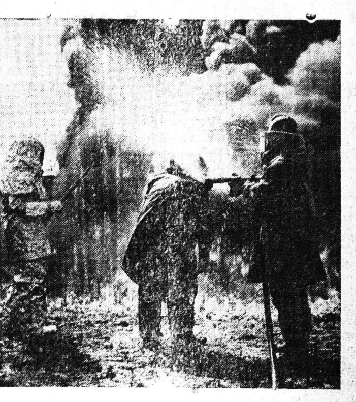
Αι Πυροσβεστικά Έγχευσαί ιδονίμασαν τελευταίως μίαν...