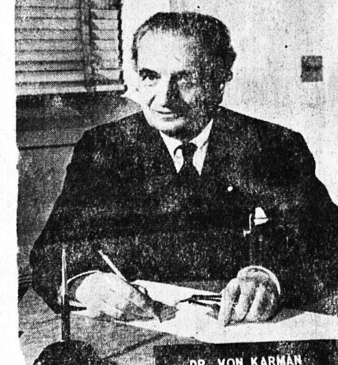
Ο Δρ Φόν Κάβμαν