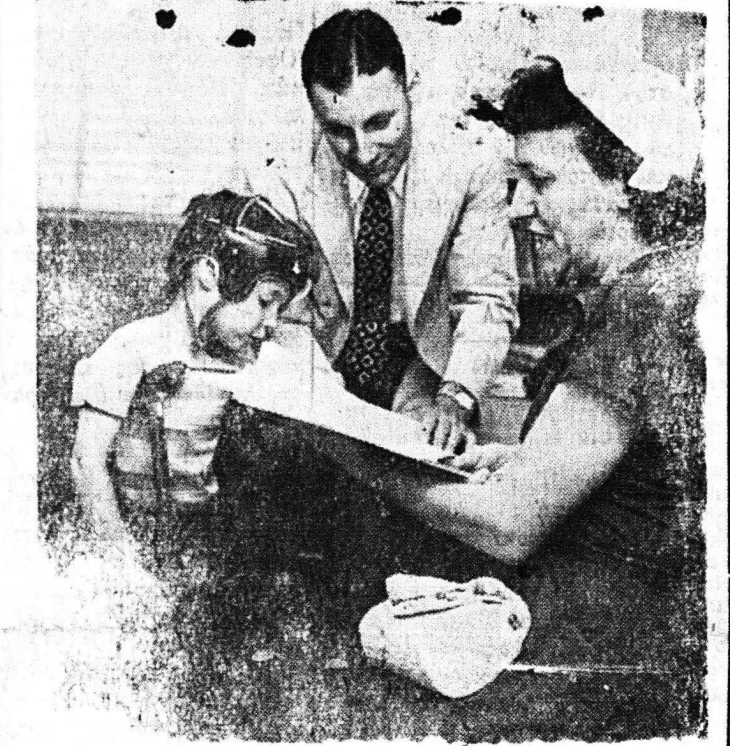
Ἡ μητέρα τοῦ κ. Ντόναλντ ἐπισκέπεται τὸν Νοσοκομεῖον συγγὰ καὶ πληροῦται εὐαὶ τὴν θεραπείαν...