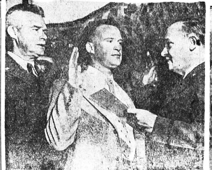
Ο στρατηγός Ουίλλιαμ Ντύν, ὁ ὁποῖος εἶχαν ἀιχμαλωτισθῆ, εἰς τὴν Κορέαν παρέστη εἰς τὴν ὁρκωμοσίαν τοῦ νεαροῦ υἱοῦ του Οὐίλλιαμ εἰς τὸ μέσον ὡς δοκιμὸν πάλιν τῆς Στρατιωτικῆς Ἀεροπορίας...