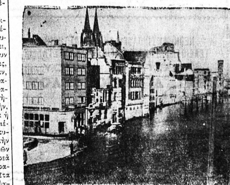
Τρεις φωτογραφίαι από τās τελευταίας πλημμύτας εις την Γαλιαν. Ως γνωστόν λόγω ύψους των υδάτων των ποταμών, όπως του Σηκουάνα κλπ. μεγάλας εκτάσεις, άλλωστε και πόλεις, όπως τόν νότιον άκρον των Παρισίων μεταβλήθησαν εις πραγματικάς λίμνας