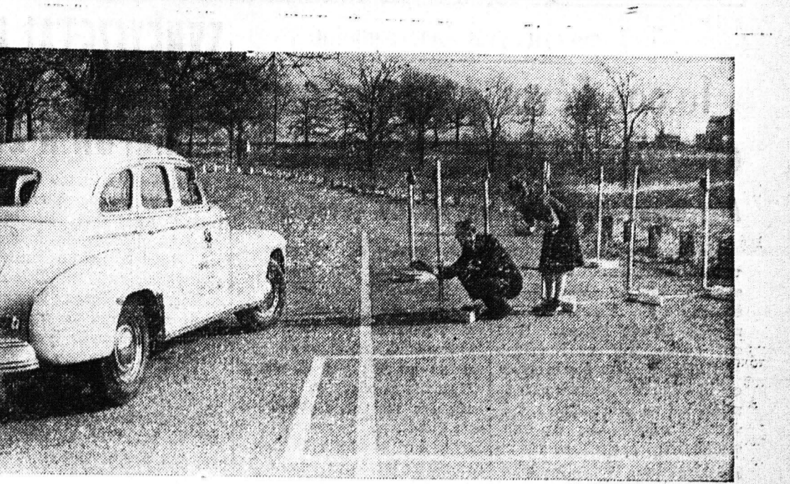
Περίπου 500.000 μαθηταὶ εἰς 8.000 γυμνάσια καὶ ἀνώτερα ἐκπαιδευτικὰ ἰδρύματα τῶν ἠνωμένων Πολιτειῶν διδάσκονται πῶς νὰ δὴσῶν αὐτοκίνητα. Εἰς τὴν φωτογραφίαν μίας μαθητῆς δὴσῶν τὸ αὐτοκίνητόν της εἰς μίαν ὑποθετικὴν στενὴν εἴσοδον ἐνὸς γυμνασίου, ἣτις ὀρίζεται μετὰ τῶν ἐκπαιδευτικῶν πασῶν

ἈΘΗΝΑΙ. Ἐπὶ τοῦ αἰτήματος τῆς παρασχῆς ἐπιδοτήσεως ἐπὶ τῶν φοιτητῶν διὰ ὅσους προμηθύνονται οἱ ἄποροι ἀπὸ διὰ τὰ φαρμακεία τοῦ Κράτους παρατίθει ἡ ἐπιχορηγία διὰ τὸν ἑκάστον νόμον διὰ περιλαμβάνει τὸν ἀπόροισ πολύτεκνον. Ἡ ἀρμόδια ὑπηρεσία τοῦ ὑπουργείου Προνοίας, μελετᾶ τὸ θέμα καὶ εἰς τὴν ἐπιτροπὴν καθ' ἣν κρηθῆναι τὰ περιθώρια κέρδους τῶν φαρμακοποιῶν ἐπιτρέψουν τὴν παρασχῆν ἐπιδοτήσεως εἰς τὸν πολυτέκνον θὰ ἐισηγήθη τὴν ψήφισιν σχετικῶν νόμον.