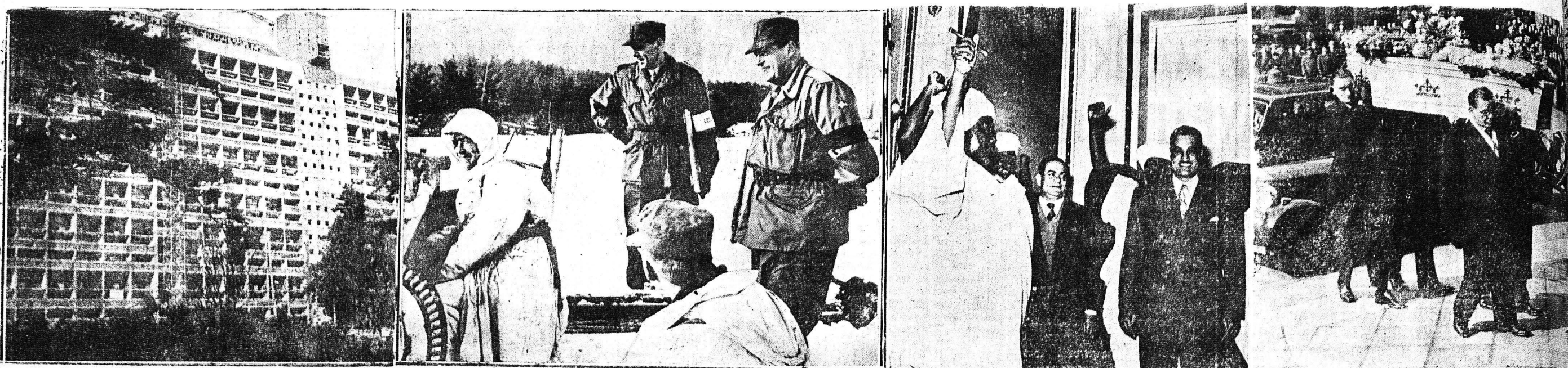
1) Είς τὸ Ρεζέ, παρὰ τὴν Νάντην τῆς Γαλλίας, συνεπληρώθη ἡ κατασκευὴ τῆς τεραστίως πολυκατοικίας τοῦ γνωστοῦ ἀρχιτέκτονος Λε Κορπουζιέ, ἡ ὁποία ἔχει 293 διαμερίσματα. 2) Περὶ τοὺς 8.000 Νορβηγοὶ στρατιῶται λαμβάνουν μέρος ἐν τῇ ἀποστολῇ τοῦ ἀποστόλου Παύλου ἐπὶ τὴν Ἰερουσαλὴμ. 3) Ὁ Αἰγύπτιος Πρωθυπουργὸς Ἀμπνέλ Νασέρ ἐδέχθη δεκαπέντε ἡγετικά μέλη τῆς Ὑπὸς Χαιτανόβια τοῦ Ἀνατολικοῦ Σουδάν. Ἀνωτέρω, ὁ ἡγέτης τῆς ἀποστολῆς τοῦ Σουδανῶν χειρὸς τὸν Αἰγύπτιον πρωθυπουργὸν κατὰ τὴν ἐξουδίαν του, ὑψώνων τὸ ξέφος του. 4) Μοριάδες λαοὶ εἶχον κατακλύσει τὸν ὄθουδον πρὸ τοῦ καθεδρικοῦ ναοῦ τοῦ Ἁγίου Παύλου τοῦ Λονδίνου καὶ μετ' ὑψηλοῦ ὄψθλκμοῦ περιηκολούθουν τὴν κηδεῖαν τοῦ πέρ Ἀλεξάντερ Φλέμιγκ. (Ἀνωτέρω χαρακτηριστικὸν στιγμιότυπον τῆς κηδεῖας.