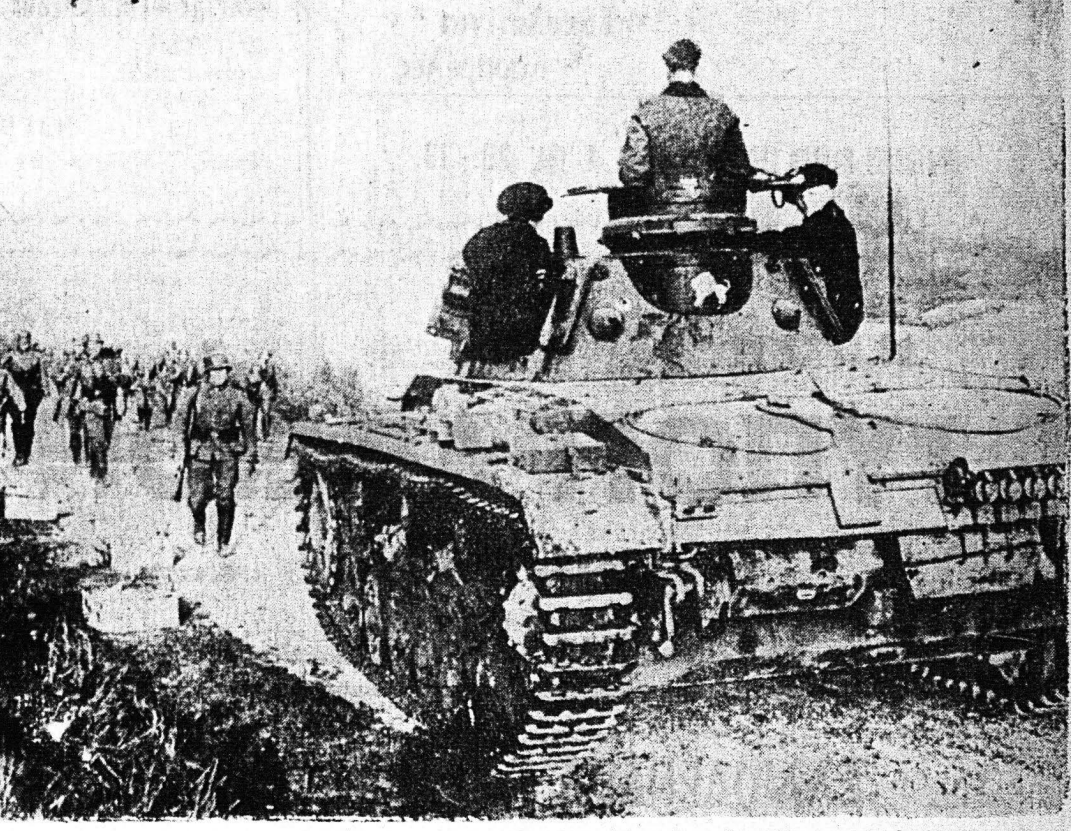
Η είσοδος των Γερμανικών στρατευμάτων εις την Αυστριακήν άπετέλεσε την άσπαρχή των γνωστών περιετρώων του Αυστριακού κράτους. Είς την εικόνα Γερμανικών τάγμασιν και πεζικόν όταν εισέβαλον εις τὴν Αυστριακήν έδαφος.