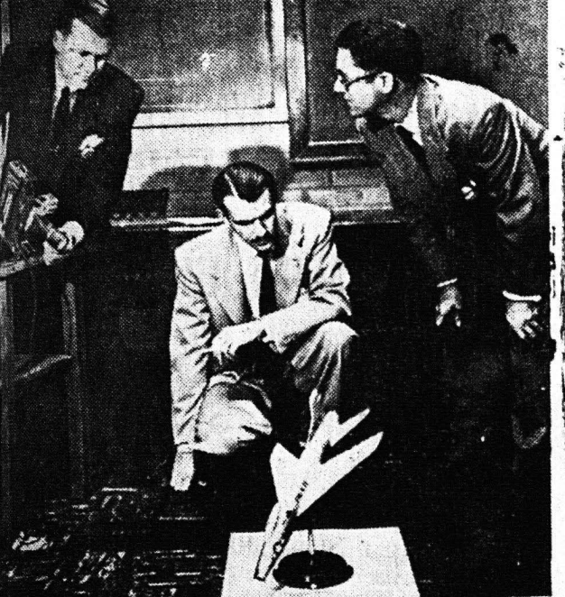
Οι μικροί μοντέλοι οι τεχνικοί της Νόρθ Αμερικαν... τασας όλας τας περιπτώσεις του δυστυχήματος.