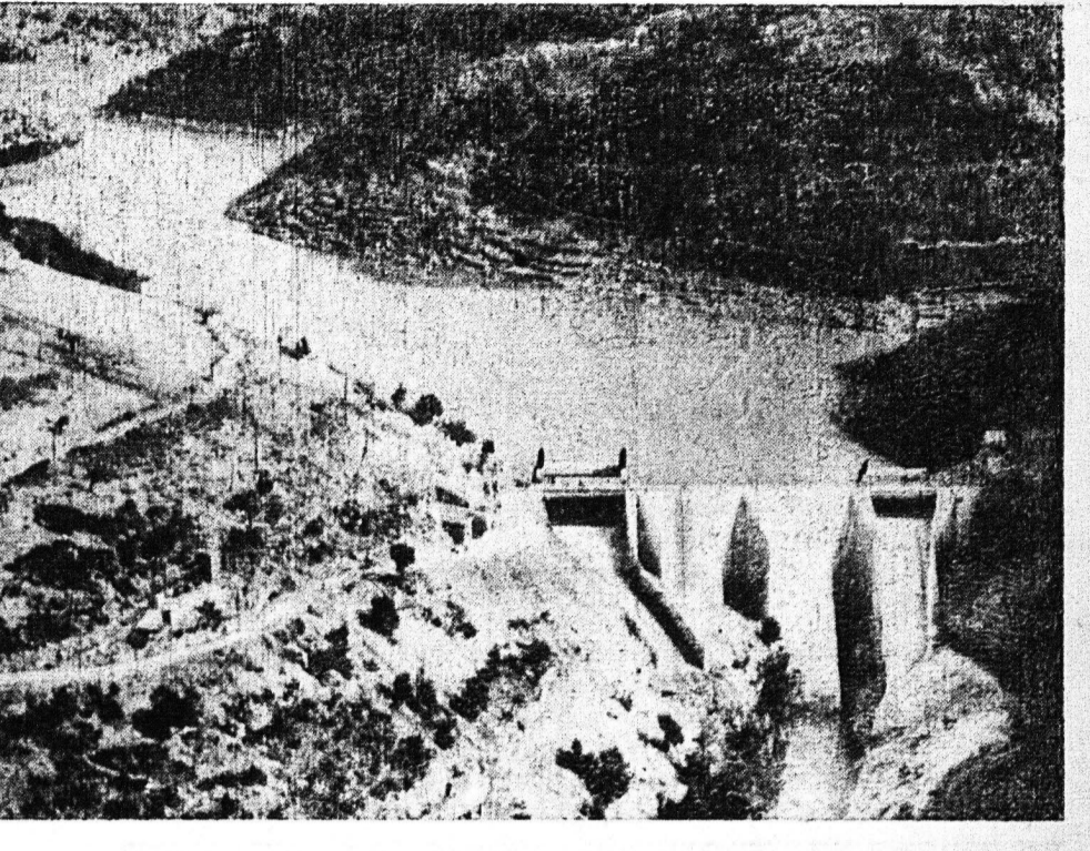
Μία πανοραμική άποψη του μεγάλου ἰδρυολεκτικῶ ἔργου αὐτοῦ του Λαδωνος, τὰ ἐπίσημα ἔργαίνα ἐτελέσθησαν τὴν παρελθούσαν Κυριακήν. Οἱ ἐκπαιδευτικοί της ΔΕΗ διεβεβαίωσαν ότι κύριος σκοπὸς αὐτῆς εἶναι ἡ παροχὴ εὐθύνου ρεύματος εἰς τὸν Ἑλληνικὸν λαόν.