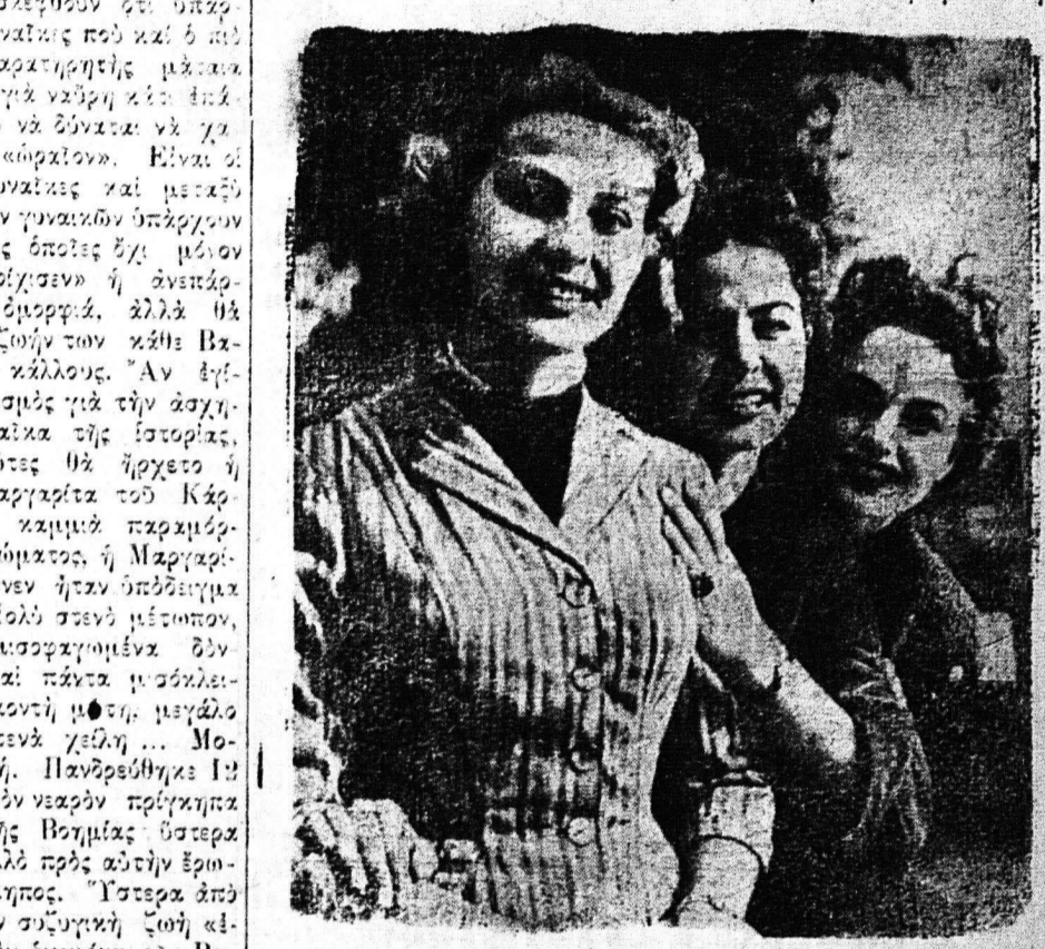
Πολλές γυναίκες χρησιμοποιούν την όμορφη του διά να κατακτήσουν την ζωή. Αλλά και η άσχημη είναι και αυτή ένα όπλον.

Οι άκατάλληλες των καλλιτεσιών είναι γυναίκες που έχουν κάνει λάθη στην ζωή τους. Οι άκατάλληλες των καλλιτεσιών είναι γυναίκες που έχουν κάνει λάθη στην ζωή τους. Οι άκατάλληλες των καλλιτεσιών είναι γυναίκες που έχουν κάνει λάθη στην ζωή τους.