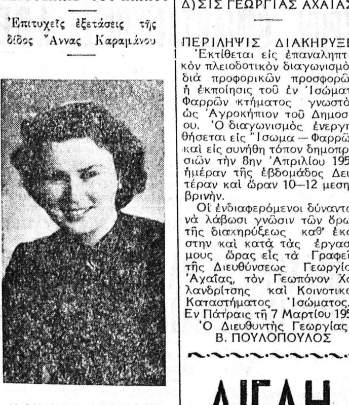
Η ΔΙΣ ANNA ΚΑΡΑΜΑΝΟΥ