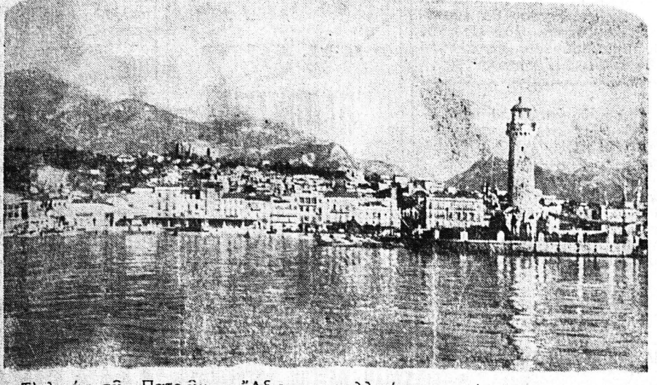
Το λιμάνι των Πατρών: "Άξιον καλλιτέρας τύχης"

Και παρέλαβον η εξεφόρτων 36.670 τόννους εμπορευμάτων