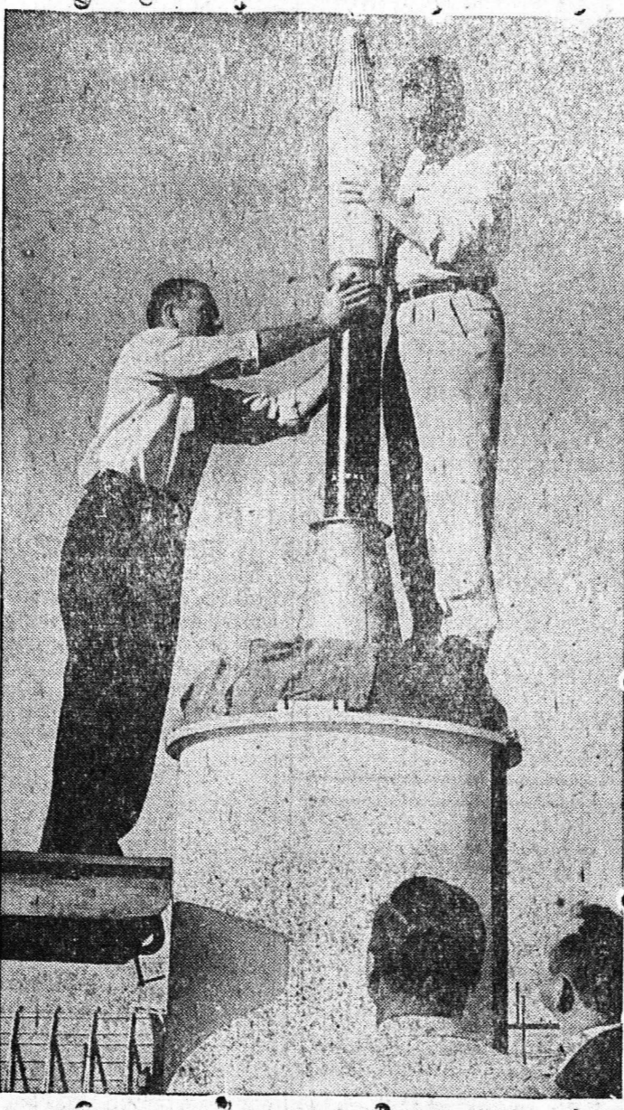
Ὁ πρῶτος ἀμερικανικὸς δορυφόρος «Ἐξερευνητὴς» συνεχίζει ἀπὸ ἐν νῆα ἡμερῶν κανονικῶς τὴν τροχίαν τοῦ περί τῆς γῆς, μεταδίδων ἀπὸ τοῦ ὕψους 3000 γιλιομέτρων...