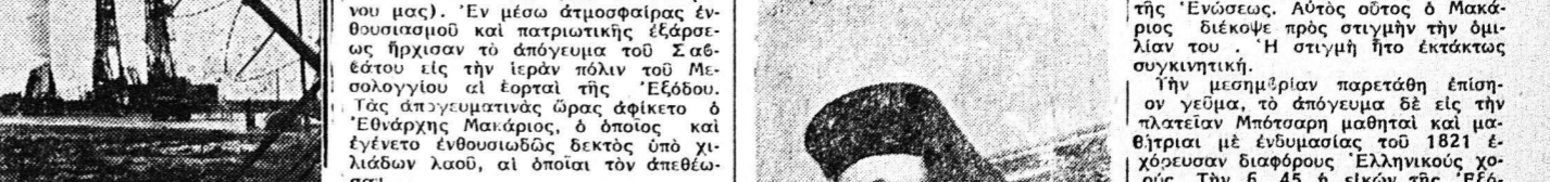
Ο της Κύπρου ΜΑΚΑΡΙΟΣ