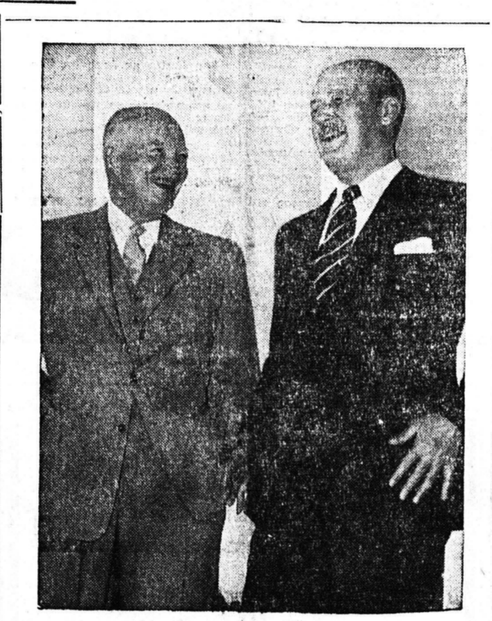
Οι κ. κ. Μάο Μιλαν και Άιζεν Χάουερ φωτογραφούμενοι έξωθεν του Λευκού Οίκου εις Ουάσινγκτον κατά την τελετησαν συνάντησιν των. Κατ' αυτήν καθύπερθε η κατά την τελετησαν συνάντησιν των Άγγλων και Ηνωμένων Πολιτειών επί των ζητημάτων της Μέσης Ανατολής και της διασκέψεως των Πέντε Μεγάλων.