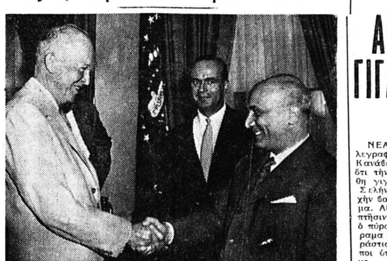
Είς την έδραν των Ηνωμένων Έθνών (αναλαμβάνεται σήμερα η αντιπροσώπευση της Γενικής Συνέλευσης του Ο.Η.Ε. Ο Έθνάρχης Μακάριος με τον Υπουργό Εξωτερικών Κ. Καραμανλή και τον Υπουργό Παιδείας Κ. Κροστίζεφ)