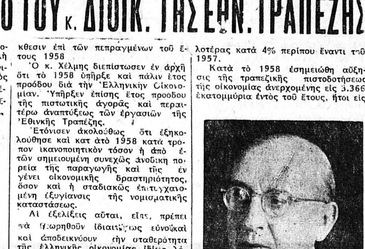
Κοινωνική κίνηση... Η ΕΞΕΛΙΞΙΣ ΤΗΣ ΕΘΝΙΚΗΣ ΟΙΚΟΝΟΜΙΑΣ ΩΣ ΕΞΕΤΕΘΗ ΥΠΟ ΤΟΥ Κ. ΔΙΟΙΚ. ΤΗΣ ΕΦ. ΤΡΑΠΕΖΗΣ