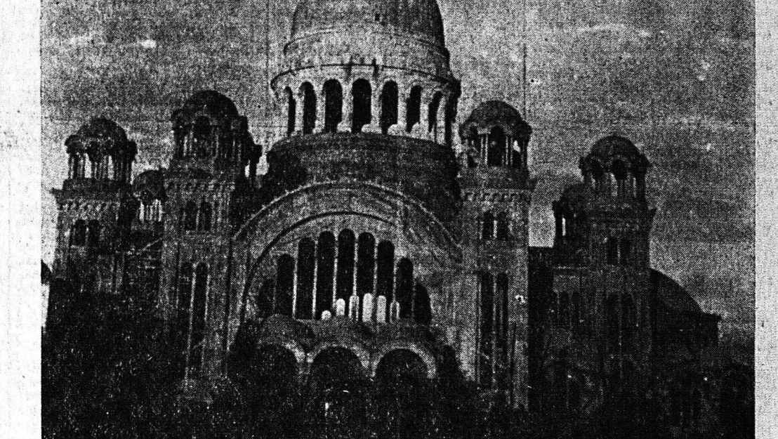
Ο ανεγείρομενος νέος ναός του 'Αγίου 'Ανδρέου, ώς έχει σήμερα