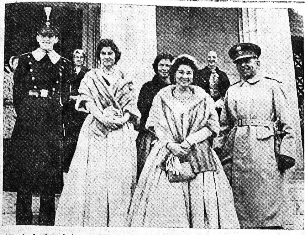
Χθές την έκτακτον άφικνεντο εις την πόλιν μας αι Α.Α.Μ.Μ. οι Βασιλείς Παύλος και Φρειδερίκη μετά της Α.Β.Υ. του Διαδόχου Κωνσταντίνου και των πριγκιπισσών Σοφίας και Ελισάβετ. Εις την εικόνα οι Βασιλείς έρχόμενοι της 'Αναδης' ας 'Αθηνών

ΟΙ ΔΑΔΦΙΛΕΙΣ ΒΑΣΙΛΕΙΣ ΜΑΣ ΑΦΙΚΟΝΤΟΙΣΙΕΣ ΠΑΤΡΑΣ