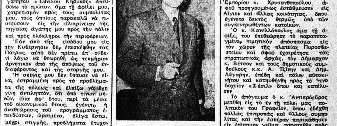
Ο κ. Π. ΚΑΝΕΛΛΟΠΟΥΛΟΣ

Ο 'Αντιπρόεδρος της Κυβερνήσεως έπαινησε συμπολιτήν κ. Παν. Κανελλόπουλον, δεχθείς χτες το απόγευμα εις ιδιαίτερον άκροατήριον... ...ως μας: