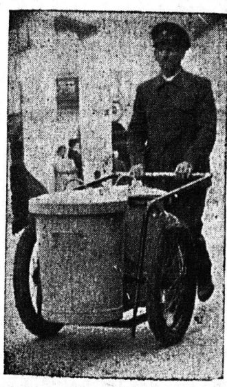
Τό φοράκι και ό βενετικός καθαριστήρας. Διά τήν καθαριότητα τής πόλεως εις τάς κεντρικάς οδούς χρησιμοποιούνται όχηματά και όμοια, όσα τόν εικονίζόμενον.

Βάσει τών ανωτέρω και έν συνδυασμώ πρός τήν τσοσιά τως έγκριθείσαν υπό τού Δημοτικού Συμβουλίου εισήγησιν τού Δημάρχου κ. Βέτσου, διέ τήν άγοράν υπό τού Δήμου κέτρων έξ καινούργιων αυτοκινήτων καθαριότητας, πρέπει να θεωρηθί βέβαιον ότι έντός τού 1960 ή νέα Δημοτική Αρχή θα έχη ολοκληρώσιν τό προϋδευτικό τών προγράμματα περί οργανώσεως τής καθαριότητας τής πόλεως, κατά τό πρότυ