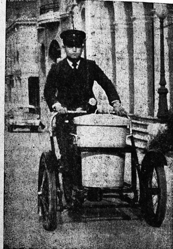
Ένα από τά νέα όχηματα που χρησιμοποιούν διά πρώτην φοράν καθαρισμόν τής πόλεως. Όμοια όχηματα χρησιμοποιούνται διά τόν λιθών και άλλας ευρωπαϊκάς πόλεις.