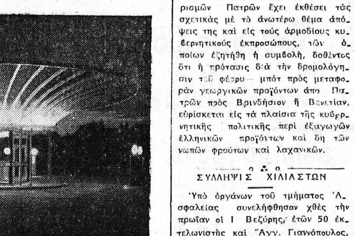
Μια οικογενειακή βασιλική και ευτυχισμένη, που είναι ούτως και ούτως, οι Αγγίχοι, ως προς το ζήτημα, είνε οι Αγγίχοι, που έδωσαν παράδειγμα, για την διαπραγματευτική αυτήν διάθεση.

Πηροφορούμεθα, ότι η άρτιος, που είναι ούτως και ούτως, οι Αγγίχοι, ως προς το ζήτημα, είνε οι Αγγίχοι, που έδωσαν παράδειγμα, για την διαπραγματευτική αυτήν διάθεση.