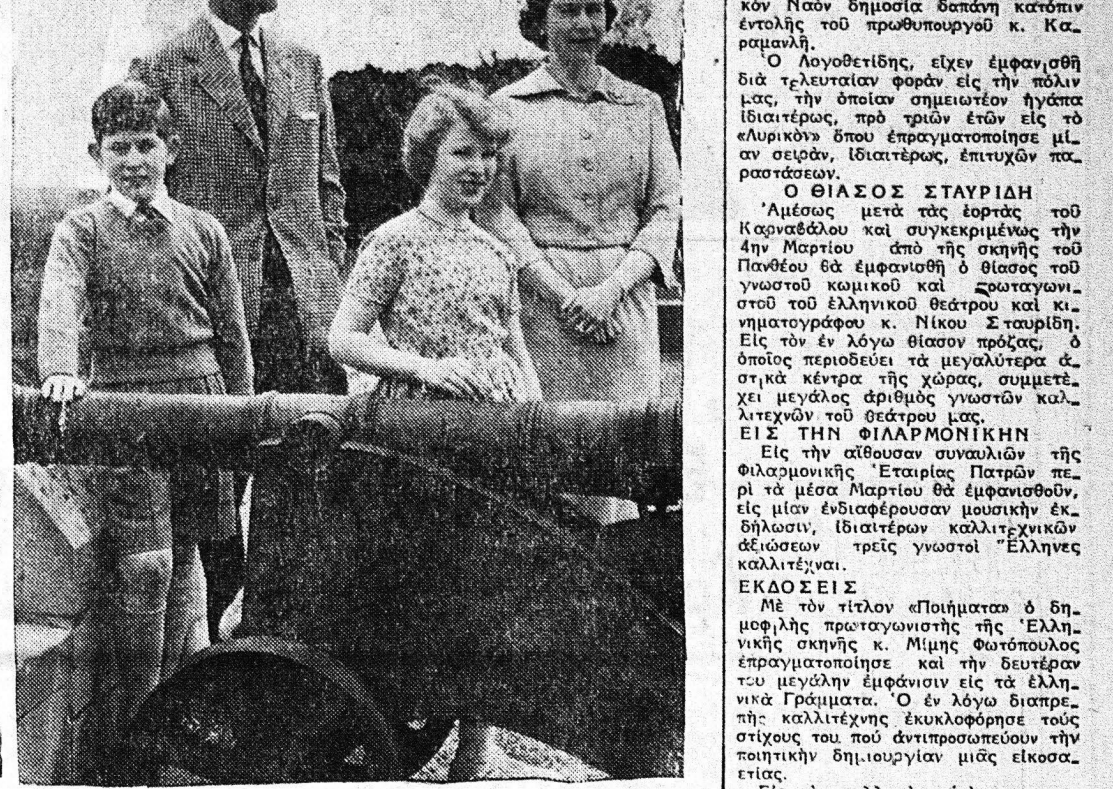
Η οικογενειακή βασιλική και ευτυχισμένη, που είναι ούτως και ούτως, οι Αγγίχοι, ως προς το ζήτημα, είνε οι Αγγίχοι, που έδωσαν παράδειγμα, για την διαπραγματευτική αυτήν διάθεση.