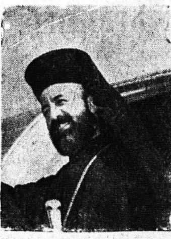
Ο ΚΥΠΡΟΥ ΜΑΚΑΡΙΟΣ