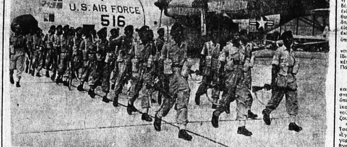
U.S. AIR FORCE 516

Ἡ ἐπιπλοκῆς τῆς περιπέλοισι Παρασκευῆς φωτογραφίας τῶν ὄρων. Τὸ ἑρώτημα εἰς τὴν ἐπιπλοκῆν εἰς τὴν ἐπιπλοκῆν εἰς τὴν ἐπιπλοκῆν.