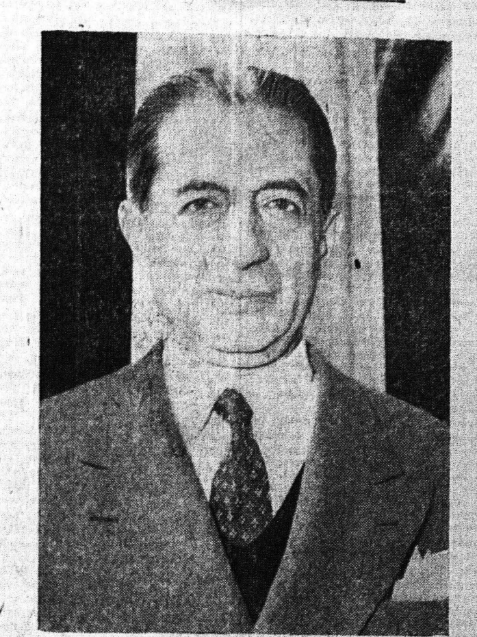
Κ. ΤΣΑΤΣΟΥ, ΠΡΕΣΒΥΤΗΣ ΤΟΥ ΠΡΕΣΒΕΙΟΥ

Τοῦ ἐπιπλοκῆς τῆς περιπέλοισι Παρασκευῆς φωτογραφίας τῶν ὄρων. Τὸ ἑρώτημα εἰς τὴν ἐπιπλοκῆν εἰς τὴν ἐπιπλοκῆν εἰς τὴν ἐπιπλοκῆν.