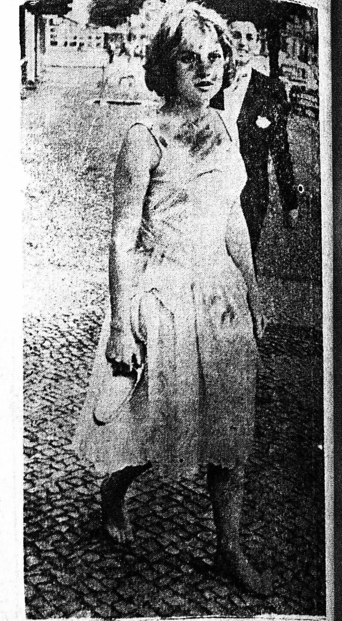
Η αδελφή της διασημής Μπριτζίτ Μπαρντ...