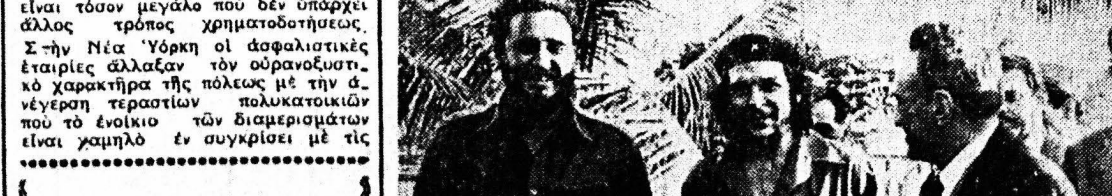
Η αδελφή της διασημής Μπριτζίτ Μπαρντ...