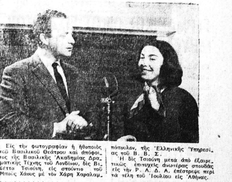
Είς τήν φωτογραφίαν η ήθοισις του Βασιλικού Θεάτρου και απόφοιτος της Βασιλικής Ακαδημίας Δραματικής Τέχνης...