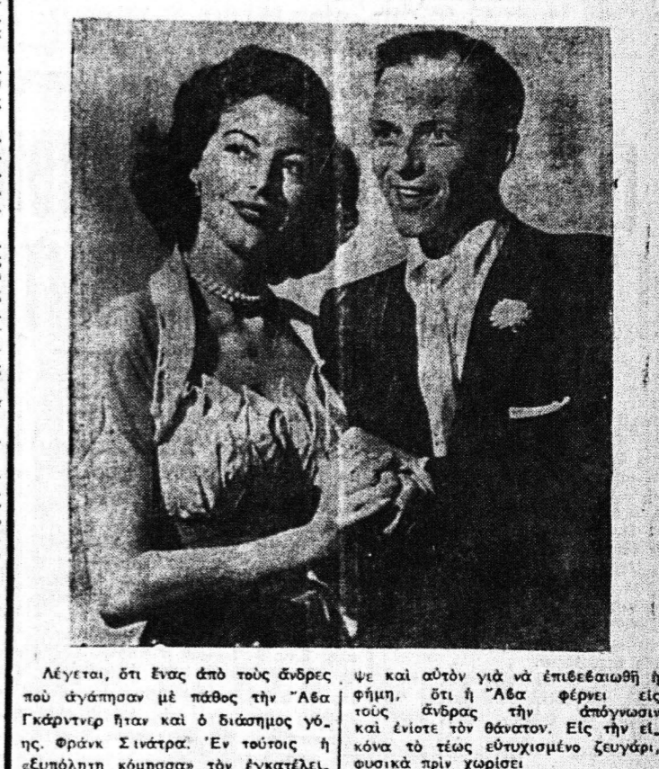
Λέγεται, ότι ένας από τους άνδρες που άγασσαν με πάθος την Άσα Γκάμπριελ ήταν και ο διάσημος γάμος Φράνκ Σινάτρας. Έν τούτοις η εξυπόλητη κόρησας τον εγκατέλειπε.

ΑΘΗΝΑΙ. (16. Σεπτεμβρίου). Λέγει εν αποδόσει ότι η κατάσταση της πολιτικής ζωής θα είναι ημερομηνία 1960. Η κυβέρνηση προέβλεπε ότι η κατάσταση της πολιτικής ζωής θα είναι ημερομηνία 1960.