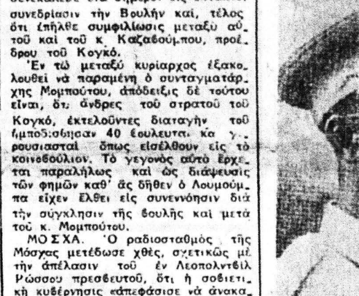
ΜΟΜΠΟΥΤΟΥ: Ὁ Κογκολίης ἀναχωρεῖ εἰς τὸ δόμο οὗοις ἔπαινον τοῦ Λουμπουμά...