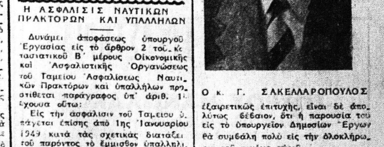
Ο Κ. Γ. ΣΑΚΕΛΛΑΡΟΠΟΥΛΟΣ ἔλαβε τὸν ἀποφάσιν...