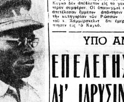
ΜΟΜΠΟΥΤΟΥ: Ὁ Κογκολίης ἀναχωρεῖ εἰς τὸ δόμο οὗοις ἔπαινον τοῦ Λουμπουμά...