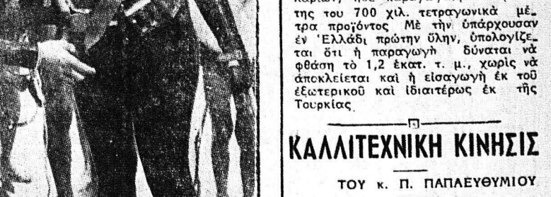
Ο Κ. Γ. ΣΑΚΕΛΛΑΡΟΠΟΥΛΟΣ ἔλαβε τὸν ἀποφάσιν...