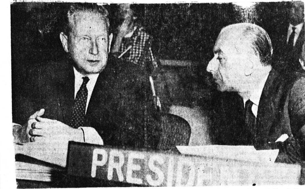
Ένώ η κατάσταση εις τὸ Κογκό εξελίσσεται εἰς δυνάμει μεγάλῃ χροῦ, τὸ Συμβούλιον Ἀσφαλείας ἀνευθερίας ἀσχολούμενον εἰς μίτην μετὰ τὴν ἐξέθεσιν...