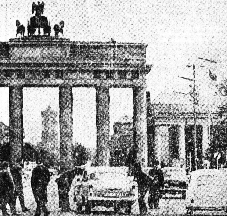
Το πρόβλημα του μέλλοντος του Βερολίνου ύψηξε το μόνον το οποίο δεν εξευτελιζότο μέχρι τότε ο κ. Κρούστσεφ...