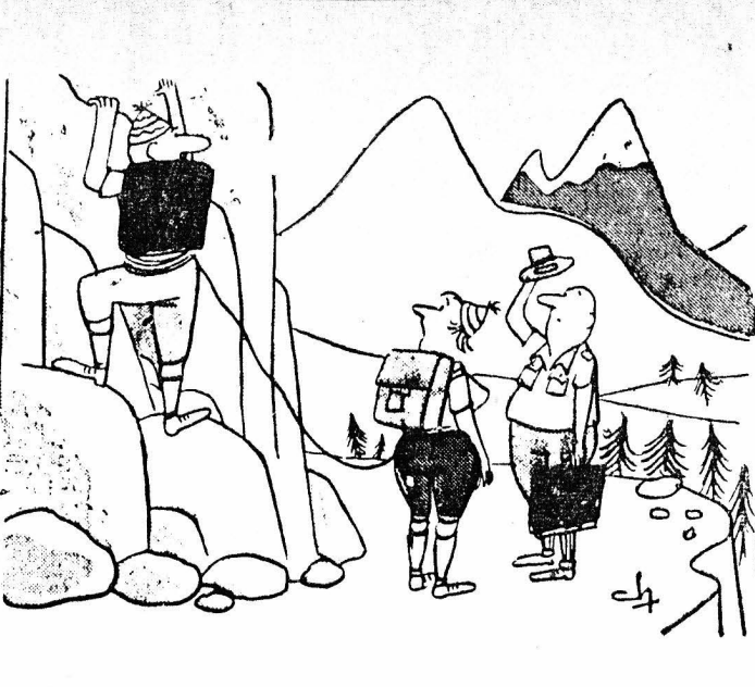
Μας προτείνει να κάνουμε μια ασφαλή ζωή...