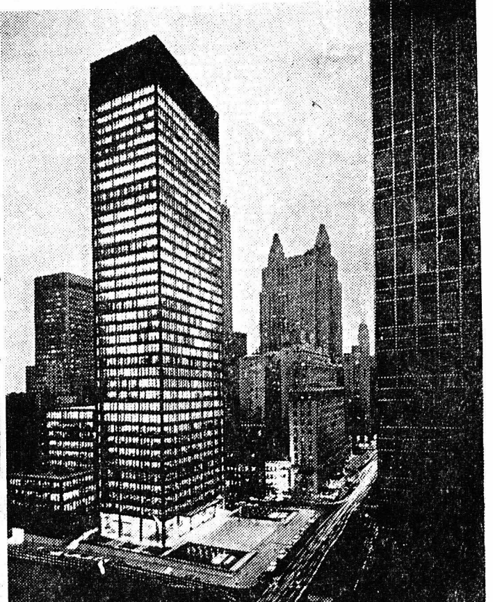
Εἰς τὸ προηγούμενον ὄμιλον εἰς τὸν ὄμιλον τοῦ «ΕΘΝΙΚΟΥ ΚΗΡΥΚΟΣ»...

ΟΠΟΥΛΟΣ Α & ΚΑΡΑΛΗΣ Α.Σ. Νικ. οἰκία Θεμισίου, 48-79 ΕΩΝ Ἀνδρ. Κασιμά Μαζώνος 48-16