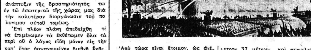
Από τόρα είναι έτοιμον, ώς άνέ...