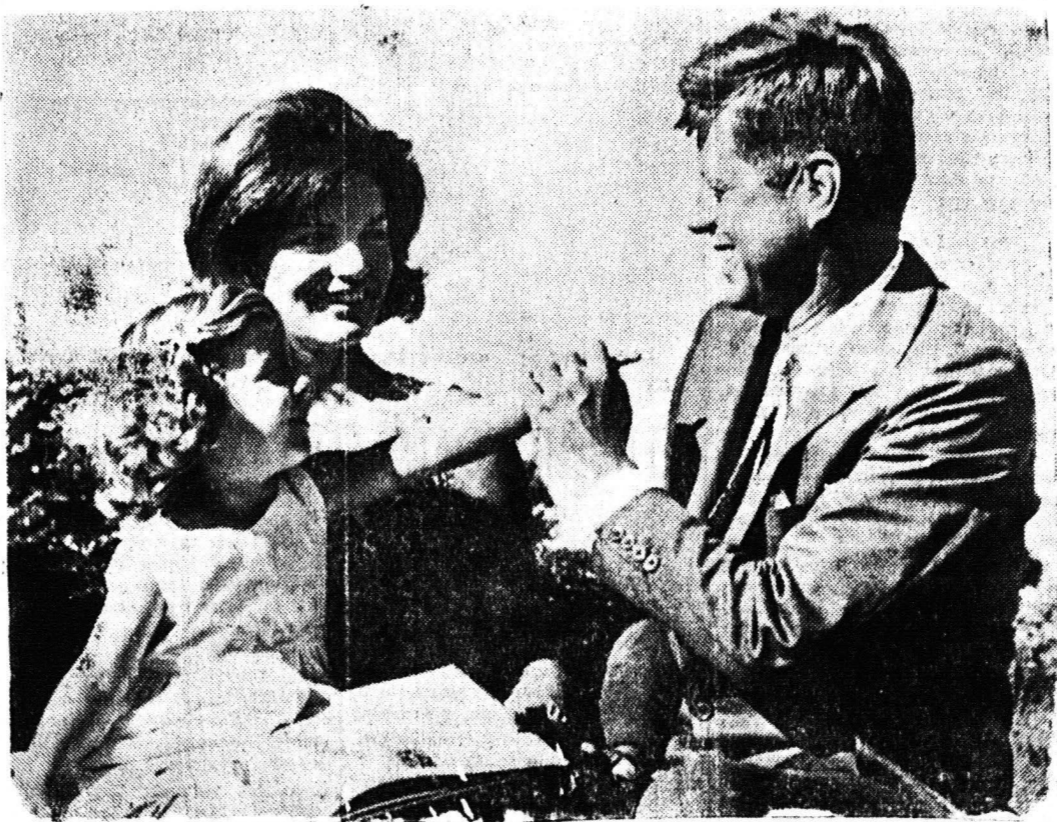
Με πρωταγωνιστή τον κ. Σοφ. Βενιζέλον