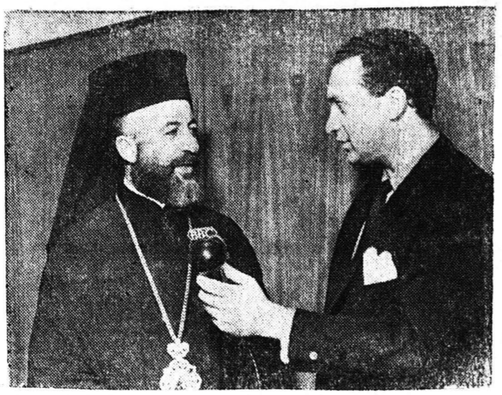
Ο Α. Ε. ο Πρόεδρος της Κυπριακής Δημοκρατίας, Αρχιεπίσκοπος Μακάριος, κατά την επίσκεψή του στο χωριό Θάυμα...