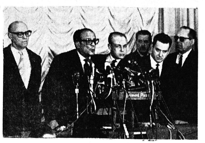
Είναι γενική η πεποίθηση ότι ο άγών δια την Κούβαν δεν έτελειω. σεν. Είς την φωτογραφία, δεύτερος έξ άριστερόν ο Δρ. Χοσέ Μίρο Καν. ταν, Πρόεδρος τού 'Επαστατικου Σιμβόλιου της Κούβας, ένώ άνα. κοινά πρός τούς άντιπροσώπους τού τύπου έίς τού ξενοδοχείον της Μπέλ.

Πισω από τού κορδόνι τών φυσικών προχωμάτων η γή ήταν κατοικήσιμη, κυρίως δέ όλη η περιοχή της Ζουίντερζε, αλλά ακριβώς κοίτες δεν μπορεί να την περιγράψη. 'Εκείνο που είναι βέβαιο, είναι ότι η θάλασσα με τού πέρασμα τών αιώ. νων έπραξε λίγο-λίγο από τού πα. ραλικού κορδόνι τών φυσικών προχω. μάτων και ιμαίνοντας μέσα σχήμα, τισ την θάλασσα που λέγονταν Ζου. ντερζε. Σ' έκείνες τις εποχές, ο άνθρωπος, μη έχοντας στη διάθεσή του τεχνικό μέσο, ίκανό να άντιμ. τοπίση, την θάλασσα, την άφηνε να καταπορχίζη, χωρίς δικαστή, και σίκαν προχωμάτων και τών τεχνικών άναχωμάτων τού από την Δύση στόν Βορρά, προσατεούονκά πλνμύδρες, τις περιοχές αυτές, που αλλοιώτικα δάταν καταδικασμένες με μόνον έ. κατοικήτες Μέσα σ' αυτές, τις έ. πλοιάσμενες από πλνμύδρες, συνεχ. χώς περιοχές, είναι ο πληθυσμός πικνότερος και είναι κτισμένες πε. ριόμενες πόλεις όπως η Χάγη, διοικη. τική πρωτεύουσα της 'Ολλανδίας, τού πό μαζι με την πολυτήρη πείρα, έκτισαν τόν άριστο, άγώνα τού ν' αλλόλαχ χαρακτήρα κοί λνγ-λίγο να πάρη αυτός την πρωτοβουλία έλ νεργείας από την θάλασσα. Είναι έ. λήθεια ότι η έπιθυμία για άναξη. ρανει όρισμένον τμημάτων γής έλ. να παλνή, αλλά τού μέσα, γενικά, π. ΣΥΝΕΧΕΙΑ έίς την 5ην σελίδα