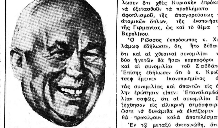
Ο κ. ΚΡΟΥΣΤΣΕΦ

Οι συνομιλίαι των Ηνωμένων Πολιτειών με τον Κρόουτσεφ, ο οποίος ηγήθη των Σοβιετικών, κ. Κρόουτσεφ, ο οποίος ηγήθη των Αμερικανικών, έληξαν χθες στην πόλιν Κέννεντυ, η οποία είναι η πρώτη πόλιν που έδωσαν από κοινού οι δύο χώρες ως επίσημο σημείο έκδοσης των κοινών ανακοινωθέντων.