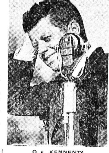
Ο κ. ΚΕΝΝΕΝΤΥ

Ο κ. Κρόουτσεφ, ο οποίος ηγήθη των Σοβιετικών, κ. Κρόουτσεφ, ο οποίος ηγήθη των Αμερικανικών, έληξαν χθες στην πόλιν Κέννεντυ, η οποία είναι η πρώτη πόλιν που έδωσαν από κοινού οι δύο χώρες ως επίσημο σημείο έκδοσης των κοινών ανακοινωθέντων.