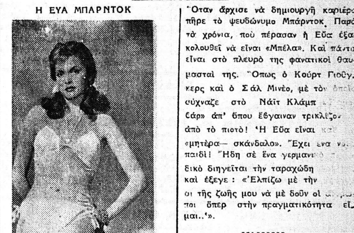
Η Εβα Μπράντο κατέχει ένα ρεκόρ που λίγες άλλες διασημότητες τού κινηματογράφου κατέχουν: άγαπήθηκε από πριγκίπισ, μεγιστόνας τού πλάτου, παιδί-μόδους (γλεντζέ-βικ) και ήθοποιός τής θόδης! Αλλά ή... ποικιλία τών θωμισμάτων, φι... και εννοείται είναι... και ότι έκανε διάκριση τήν Εβα Μπρά...