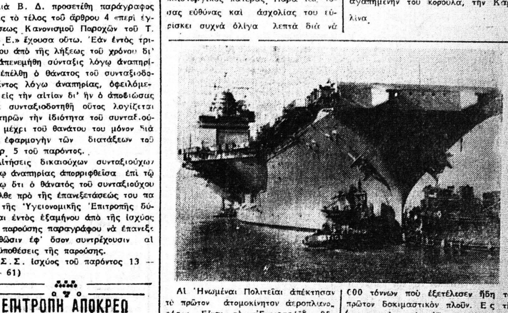
Αι Ψωμίνα Πολιτεία άπέκτησαν τού πρώτον άποκομην άρροπάλιν, 800 τόνων που έξετέλεσε ήδη τού πρώτον δοκιμαστικόν πλύν. Ες τήν φθόν. Είναι τό «Εντερπράϊζ» 85. Η φωτογραφία τό «Εντερπράϊζ».