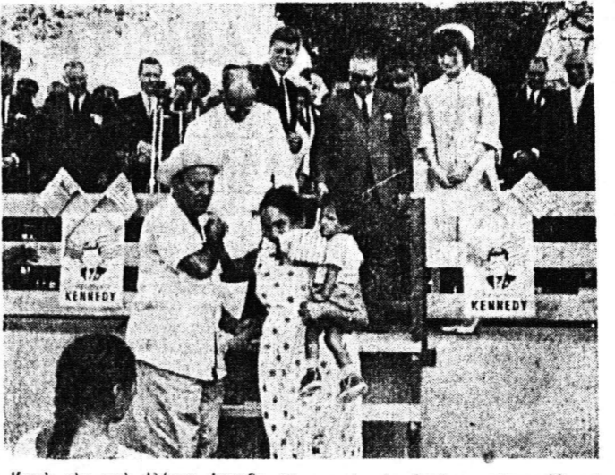
Κατὰ τὴν πρό ὀλιγων ἡμερῶν πε- ριοδείαν τὸν ἀνὰ τὰς χώρας τῆς Λα- τινικῆς Ἀμερικῆς ὁ πρόεδρος τῶν Ἠ- νωμένων Πολιτειῶν καὶ ἡ κ. Κένεν- τι παρίστησαν καὶ εἰδικὰς τελετὰς

Εργοστάσιον Φανοποιίας ΑΝΔΡΕΟΥ Π. ΨΑΛΛΙΔΑ Καραϊσκάκη 110 (πλησίον Ἐρμού—Μαρκάτο) ΠΑΤΡΑΙ Ευχόμεθα εἰς τὴν πολυπληθεῖ πελατείαν μας Πατρῶν, Περι- χώρων καὶ ἐπαρχίων. ΕΥΤΥΧΙΣΜΕΝΟΣ Ο ΚΑΙΝΟΥΡΓΙΟΣ ΧΡΟΝΟΣ 1962