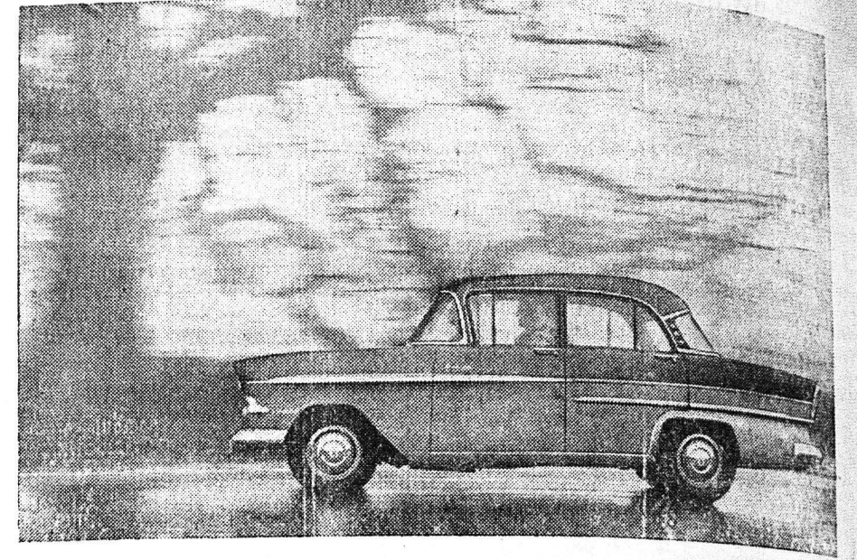
Το τελευταίον πολυτέλες μοντέλο του «Βικτωρ 2» Βολβάλ είναι διχρωμο και έχει νύκν γραμμή. Είναι όλίγον χαμηλότερον του «Βικτωρ 1» και έχει όμοιαν άλλαν διαφοράς από τούτο, τούς προφυλακτικούς κα τήν πλάση πέτρα.