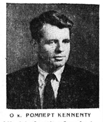
Ο κ. ΡΟΜΠΕΡΤ ΚΕΝΝΕΤΥ